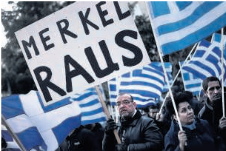
Zo'n duizend ultra-nationalistische Grieken demonstreren in Athene tegen het reddingsplan van de EU voor Cyprus.

Tegelijk zadelt deze Europese crisis Merkel zo met haar eigen dilemma op: de schuldenstaten vallen over Merkel heen vanwege de hardne-